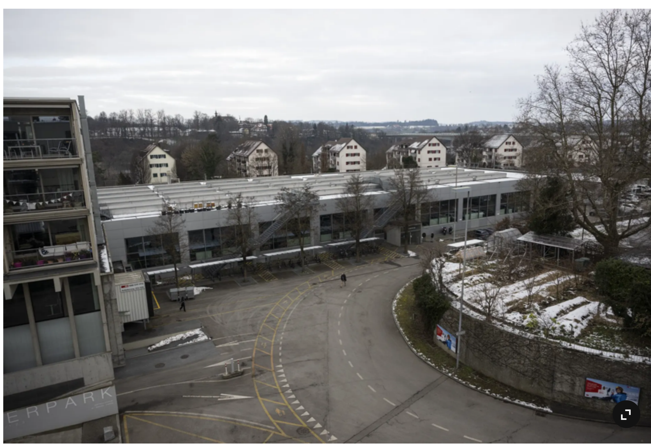
Die Velobrücke soll dereinst von der Wylerstrasse am Wylerpark (links im Bild) vorbei und über die Aare in die Länggasse führen.

Eine Velobrücke zwischen Breitenrain und Länggasse für rund 20 Millionen Franken? Die Idee liess bei jenen Politikerinnen und Politikern in der Stadt Bern, die der Förderung des Veloverkehrs keine Priorität beimessen, stets zuverlässig die Emotionen hochkochen. Dann wurde es still um das Projekt, zu klamm präsentierten sich die Stadtfinanzen auf absehbare Zeit.