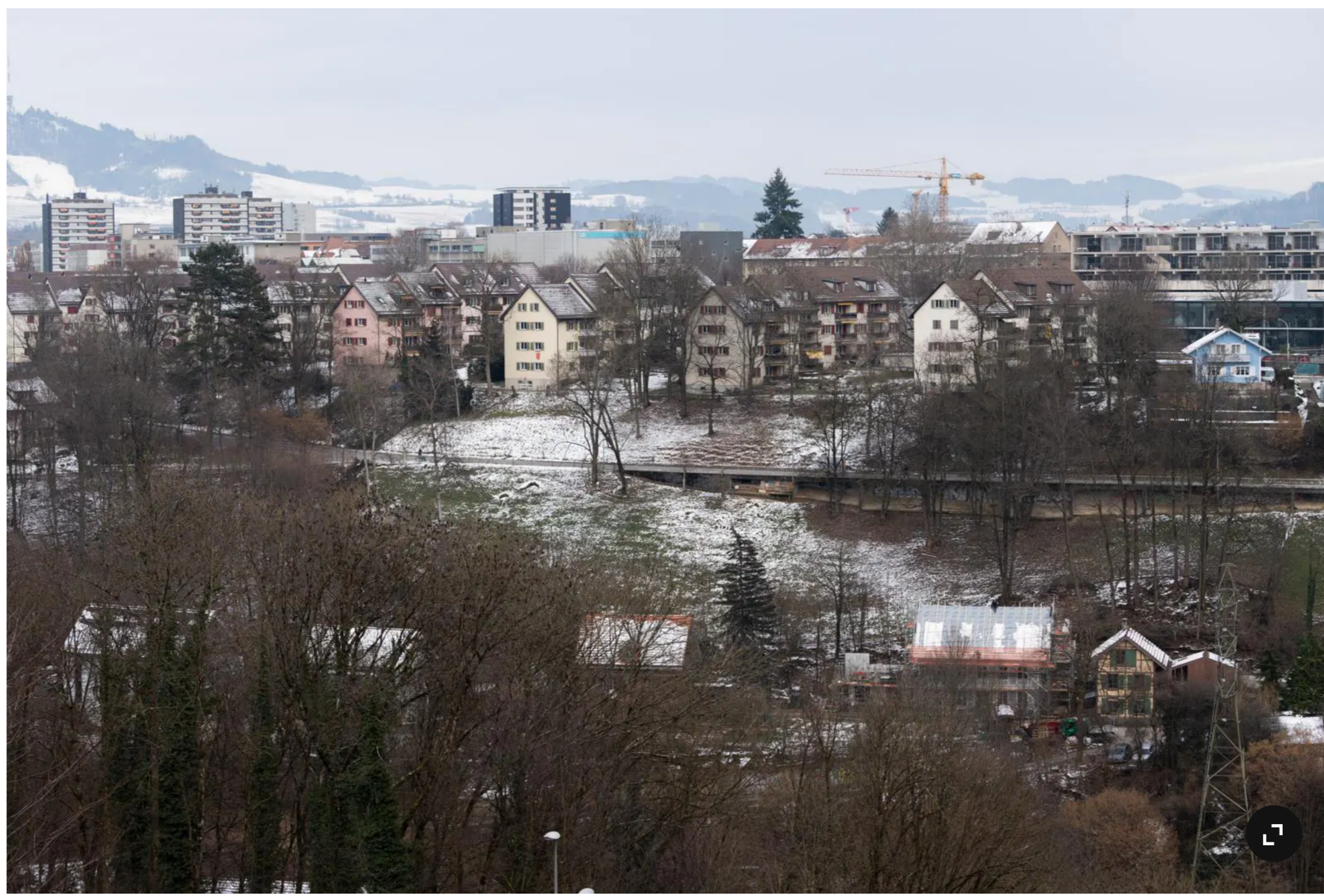
Auf Seite Länggasse käme die Brücke auf den Neufeldtunnel zu liegen. Hinten am rechten Bildrand ist wieder der SBB-Wylerpark zu sehen.